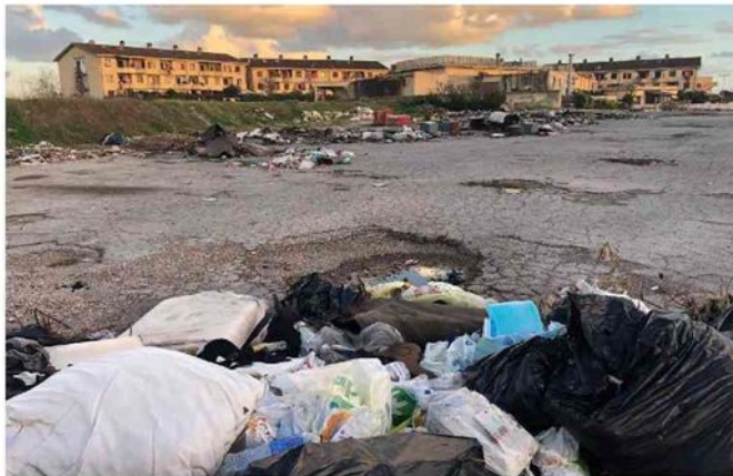
Il degrado ad Ardea: una discarica a cielo aperto vicina alle abitazioni. GIOVANNINI, ROSSI E IL REPORTAGE DI ZANCAN — PP. 10-11