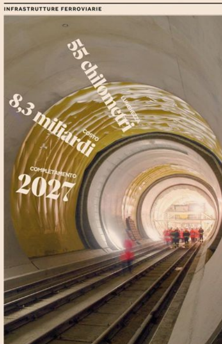
Masi-opera. Il cantiere del nuovo tunnel ferroviario di base del Brennero: collegherà Innsbruck a Fortezza (Bolzano)