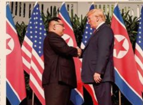
Singapore. La stretta di mano tra Kim Jong-un e Donald Trump