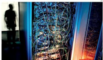
Robot e big data. 1. Intelligenza artificiale, utilizzata in finanza (e non solo) è utile. Tuttavia la sua complessità può rendere incomprensibile agli stessi esperti. Vittorio Carlini • pagina 11

Per il superammortamento aliquota ridotta al 130%, l'«iper» resta al 250%