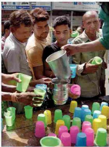
Uomini in coda per dell'acqua a New Delhi: in India è allarme siccità Pizzati A PAG. 3